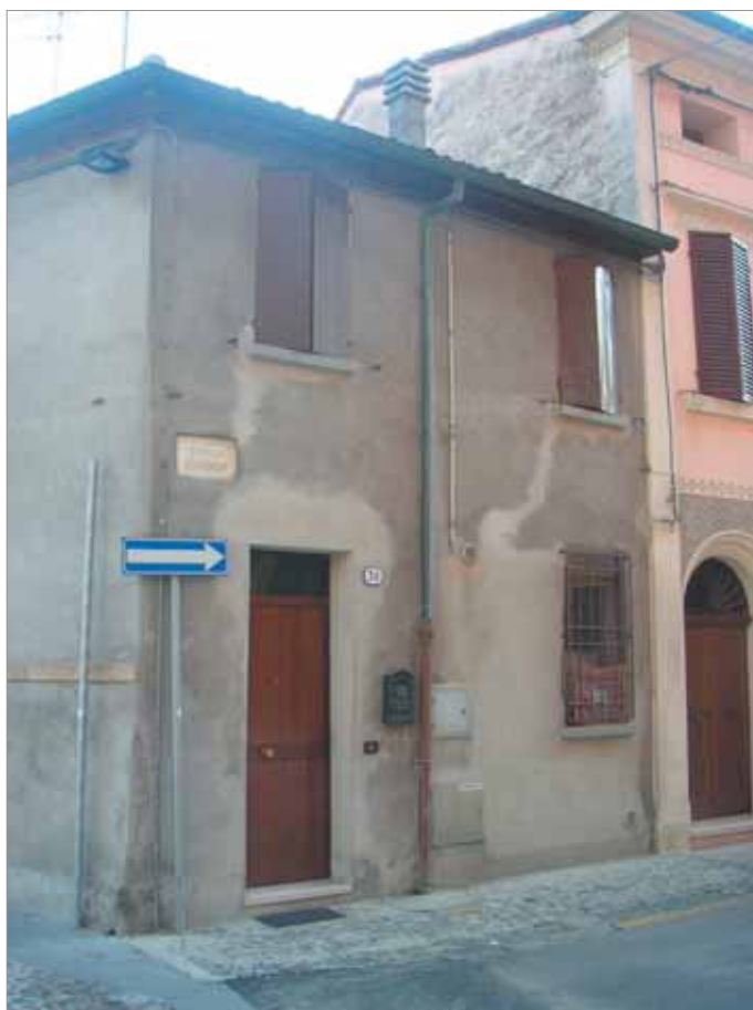
Via Ramenghi 30 Fronte Principale